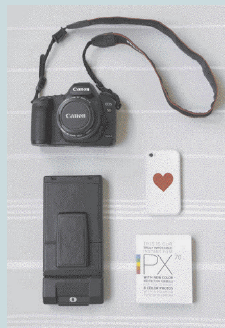
POWYŻEJ: Mój osobisty zestaw fotograficzny do codziennego robienia zdjęć: 5D Mark II (DSLR), Sonar SX-70 (Polaroid), klisza błyskawiczna do Impossible Project dla SX-70 i mój iPhone do robienia spontanicznych zdjęć.

Spróbuj poczuć, jak się czujesz, trzymając w ręku konkretny model aparatu. Czy czujesz się onieśmielony, czy podekscytowany? Zawsze wybieraj aparat, który sprawi, że poczujesz energię do robienia zdjęć! Kiedy onieśmielony, chowasz się przed własną siłą, tracisz okazję, aby w pełni wyrazić swój indywidualny punkt widzenia i zastanowić się, co motywuje Cię do ciągłego fotografowania.