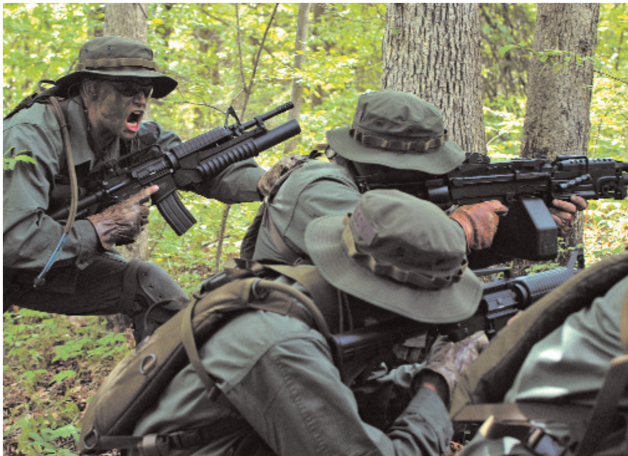
Komendy ustne wciąż stanowią ogromną większość metod dowodzenia. Bezpośredni dowódcy utrzymują bliski kontakt ze swoimi podwładnymi i prowadzą ich działania. Komendy ustne oraz sygnały dłonią ramieniem dominują na polu bitewnym w oddziałach piechoty.

W kwestii języka komunikacji radiowej, procedury i SOI, najlepszym sposobem, by się ich nauczyć, jest je stosować! Korzystaj z SOI/CEOI podczas planowania, ćwiczeń i wykonywania każdej misji. Komunikacja musi być chroniona. Dziel się SOI z każdym zaangażowanym w misję, ale z nikim innym!